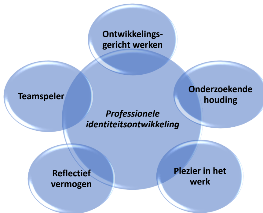
Figuur 1: Dynamische docent AOS MB

We formuleren geen beroepsbeeld met vaardigheden of kennis die afgevinkt kunnen worden. In het beroepsbeeld van AOS MB staat de houding van de docent centraal: het blijven leren en zich ontwikkelen. Steeds opnieuw, voor alle betrokkenen in AOS MB, stellen we de vraag wat de ontwikkelvragen zijn en hoe deze vormgegeven kunnen worden.